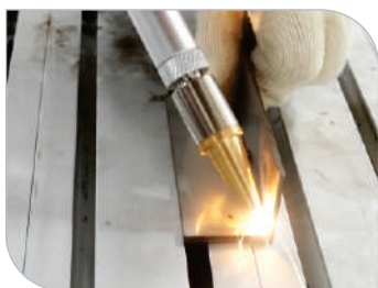
Junta em ângulo