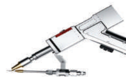
Tocha de 7ª geração para corte, solda e limpeza com guia de arame externo.