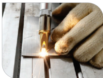
Junta de topo

Com diferentes bocais, é possível realizar a soldagem de diferentes juntas