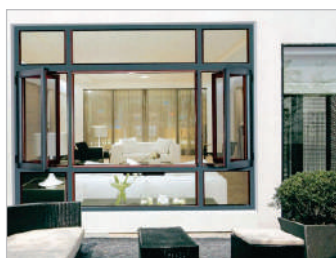
Portas e janelas