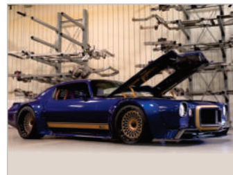
Reparo e Customização Automotiva