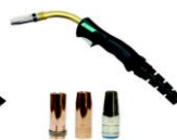
Tochas MIG/MAG e consumíveis