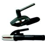
Porta eletrodos e garras negativas