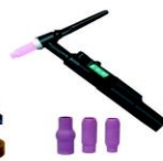
Tochas TIG e consumíveis