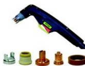
Tocha corte plasma e consumíveis