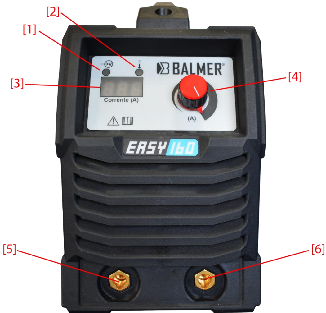
Figura 4 – Detalhe painel frontal

Posição [1]: LED indicador de máquina ligada;